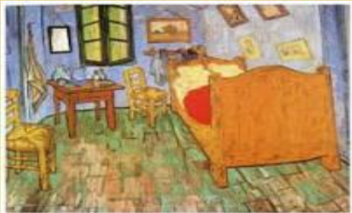
Βαν Γκογκ, Η Κρεβατοκόμρα, 1889, Εθνικό Μουσείο Βαν Γκογκ, Άμστερνταμ